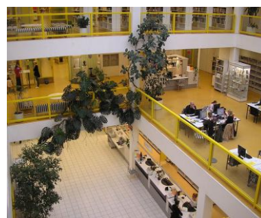
Interno della università

“Terve!”: siamo molto felici di potervi introdurre nell’Università di Pedagogia e nelle scuole di Jyväskylä che rappresentano nel mondo un'eccellenza in campo educativo.