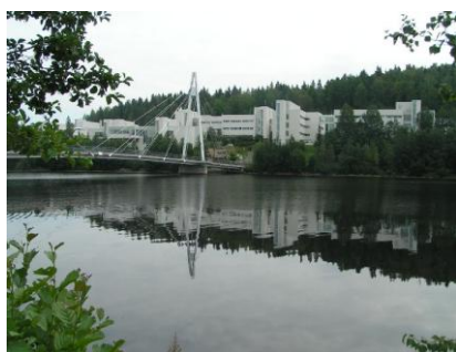
Università di Jyväskylä